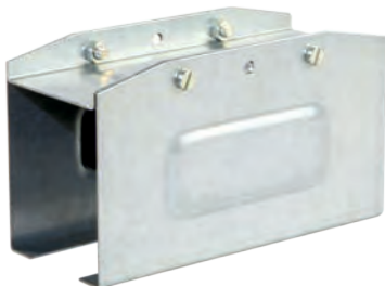
Соединительный элемент КТ