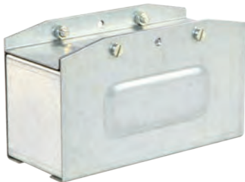
Торцевая крышка КТ