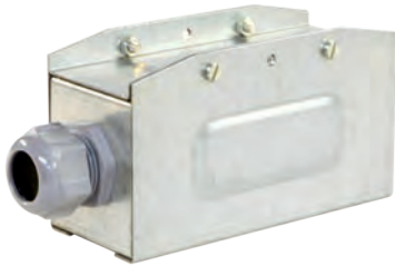
Питающий элемент КТ