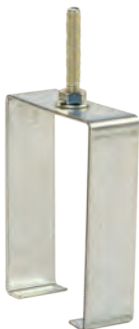
Скользящая подвеска КТ