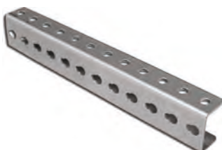
Подвесная скоба ТВ